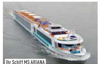
Ihr Schiff MS ARIANA