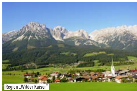
Region „Wilder Kaiser“

Tiroler Gastfreundschaft, die imposante Bergkulisse des Wilden Kaisers und die Topstars der Volks- und Schlagermusik: dieser gelungene Mix hat den Alpenländischen Musikherbst in Ellmau, einem der schönsten Tiroler Bergdörfer, zum erfolgreichsten Volksmusikfest im Alpenraum werden lassen. Das bekannteste Volksmusikfest im Alpenraum mit den absoluten Stars der Branche hat schon tausende Gäste begeistert. Seien auch Sie dabei!