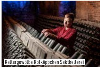
Kellergewölbe Rotkäppchen Sektkellerei