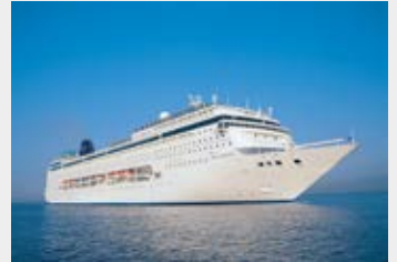
Hochseekreuzfahrten ab S.4