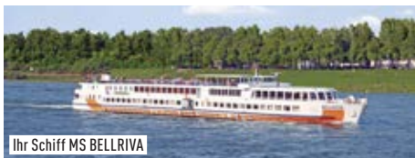
Ihr Schiff MS BELLRIVA

BONN: Weihnachtsmarkt (individuell) KOBLENZ: Spaziergänge (individuell) RÜDESHEIM: Weihnachtsmarkt der Nationen (individuell) WIESBADEN: Sternschnuppenmarkt (individuell) Stadtrundfahrt Frankfurt & Weihnachtsmarkt (35,-) MAINZ: Weihnachtsmarkt (individuell)