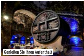
Genießen Sie Ihren Aufenthalt