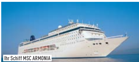
Ihr Schiff MSC ARMONIA

Auszug deutschsprachiges Ausflugsprogramm HAVANNA: Auf den Spuren Hemingways (59,-) GEORGE TOWN: Inselfahrt & Strandausflug (69,-) COZUMEL: Maya Ruinen Tulum (92,-) ROATAN: Schnorcheln am Schiffswrack (65,-) (ca.-Preise p.P./€)