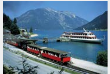
Bus- & Erlebnisreisen S.3