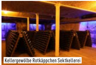
Kellergewölbe Rotkäppchen Sektkellerei