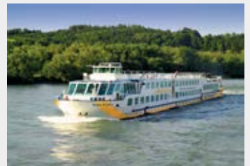
Fluskreuzfahrten ab S.6