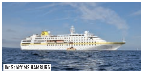
Ihr Schiff MS HAMBURG

Auszug deutschsprachiges Ausflugsprogramm QUEBEC: Stadtrundgang & Kutschfahrt GASPÉ: Walbeobachtung HAMILTON: Segeltour NASSAU: Ardastra Gardens (kostenpflichtig)