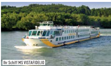
Ihr Schiff MS VISTAFIDELIO