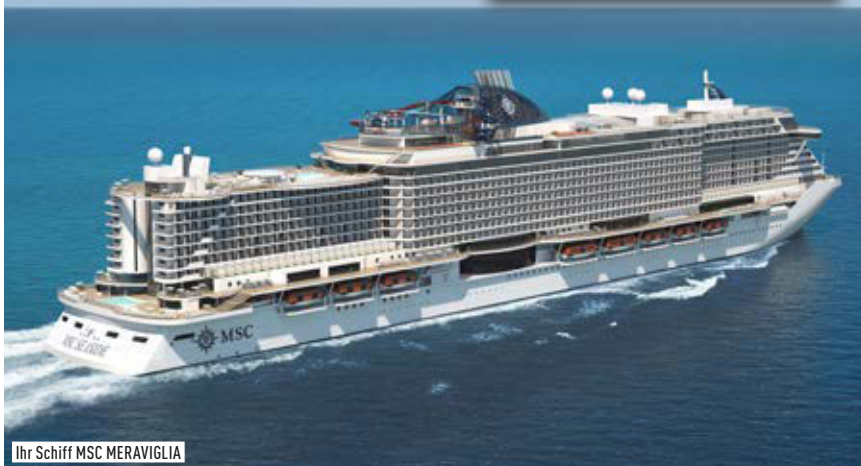
Ihr Schiff MSC MERAVIGLIA

Exklusive Sonderpreise bei Buchung bis 16.12.2017