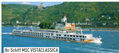
Ihr Schiff MSC VISTACLASSICA