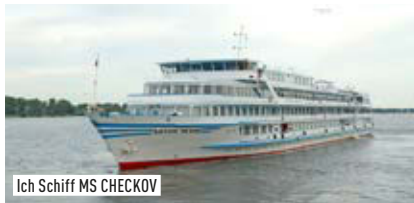
Ich Schiff MS CHEKHOV