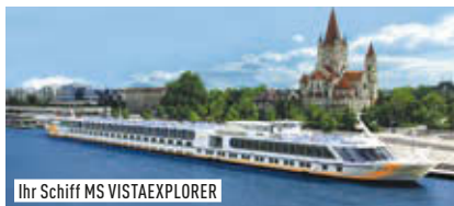
Ihr Schiff MS VISTAEXPLORER

Ihr deutschsprachiges Superior-Schiff: MS VISTAEXPLORER