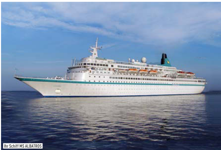
Ihr Schiff MS ALBATROS